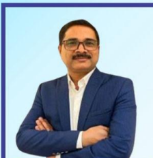
The Business Head of Methods Apparel Consultancy.