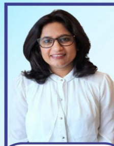
The Managing Director of Methods Apparel Consultancy India Pvt. Ltd.